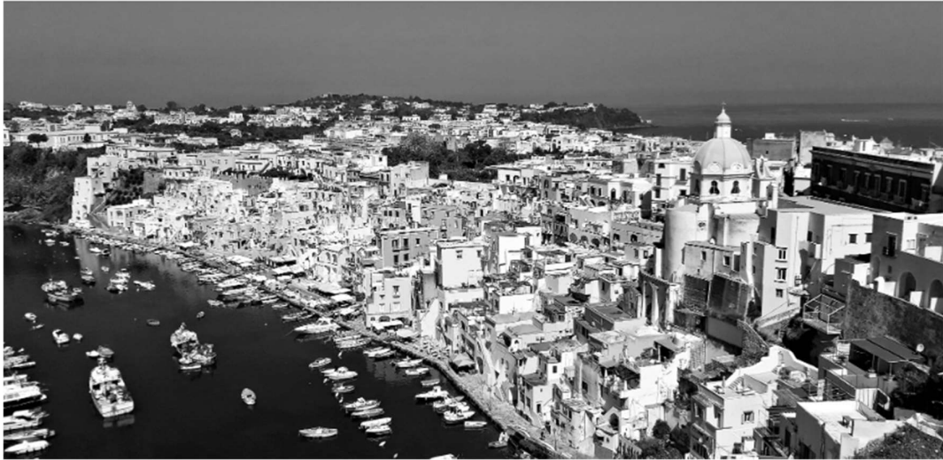
Legenda: Charms of morning sky. / Massimo Donadio/ 23 de maio de 2023