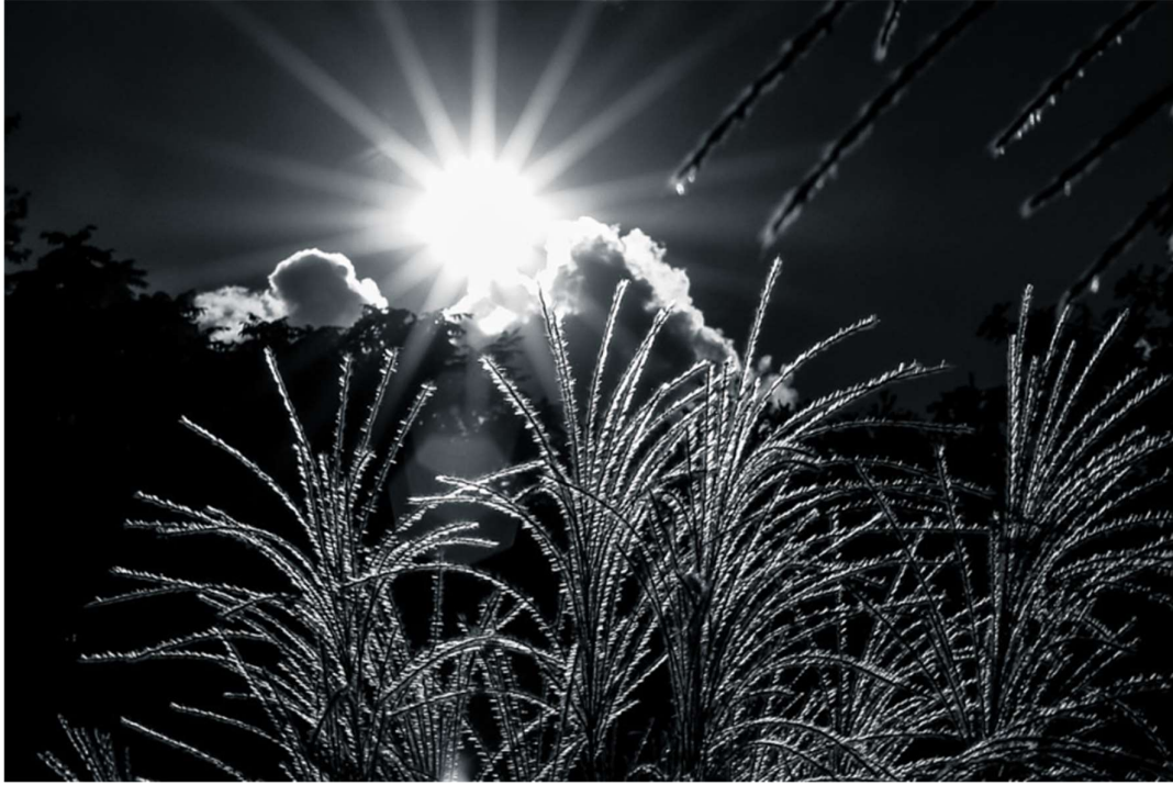
Legenda: Power of the Sun!. / John Mikula/ 24 de setembro de 2012.