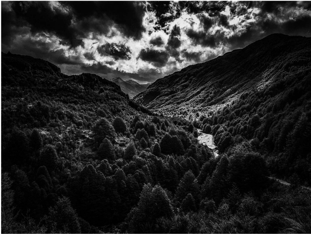
Legenda: Patagonia Chilena./ Fotográfica Patagonia/ 23 de Janeiro de 2022