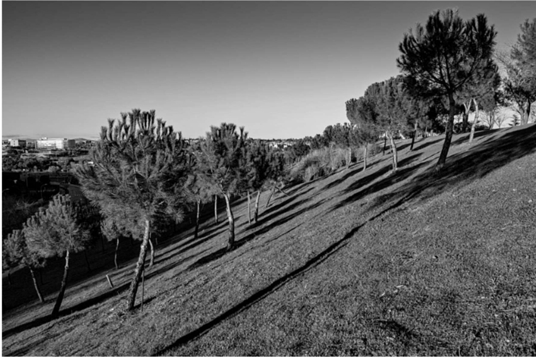
Legenda: Hillside of pine trees. / Vicente Molinero/ 3 de janeiro de 2023.