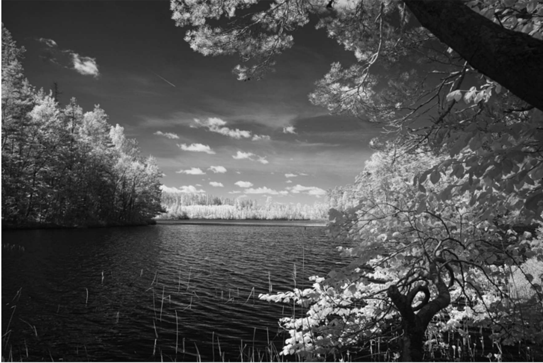
Legenda: Lake Wiev. / metallund metalhund/ 15 de maio de 2022