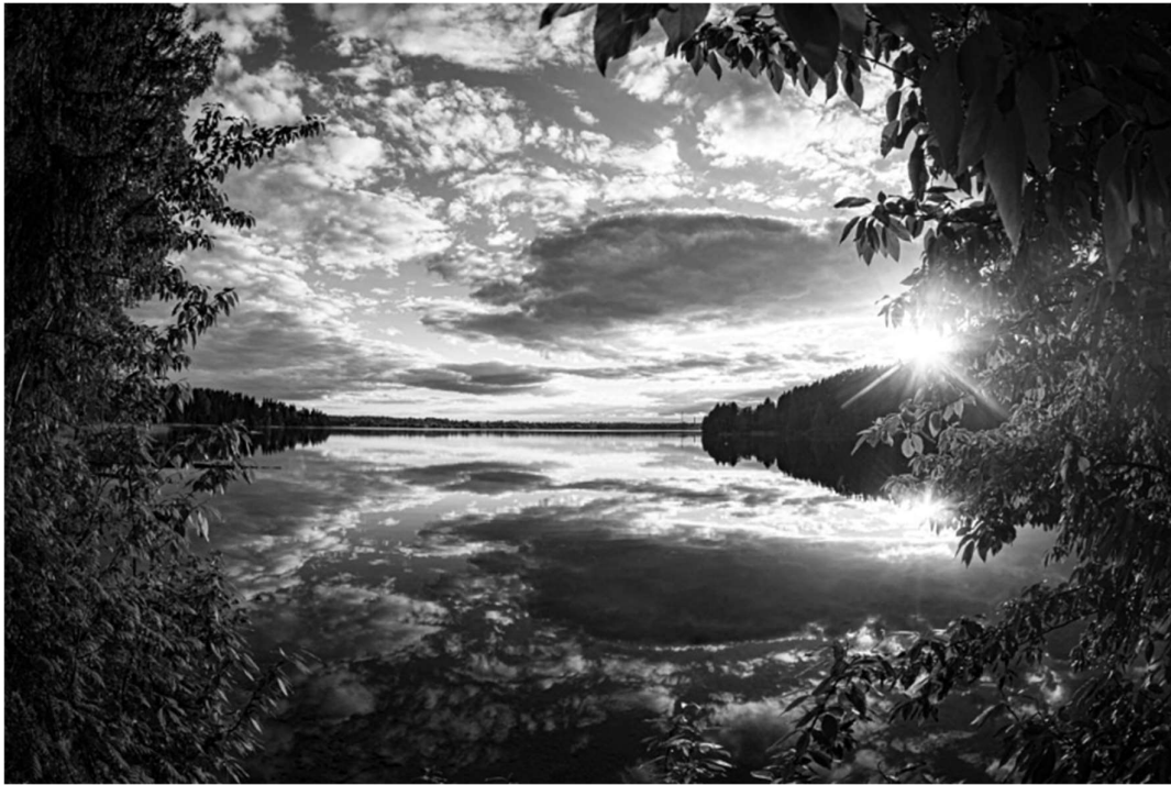
Legenda: Valdai. / António D'Batonio/ 31 de maio de 2021.