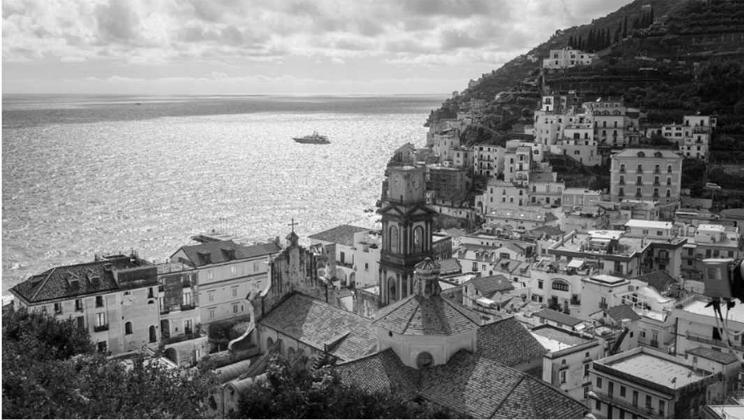
Legenda: Minori. / 29 de setembro de 2022.