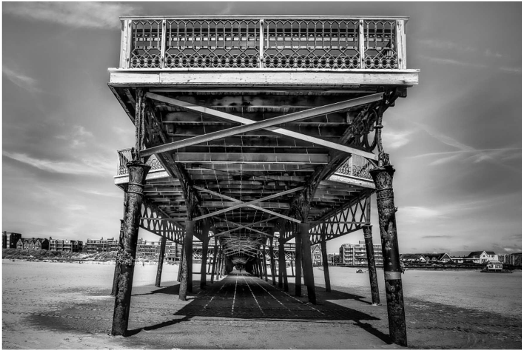
Legenda: Luz no fim do cais. Em um dia ensolarado, pequenas frechas de luz brilhavam através das frechas do passadiço do cais de St. Annes./ Ian Hayox/ 14 de junho de 2022.