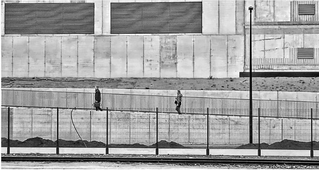
Legenda: Walk to Work in town. / MiRy/ há quase 2 anos.