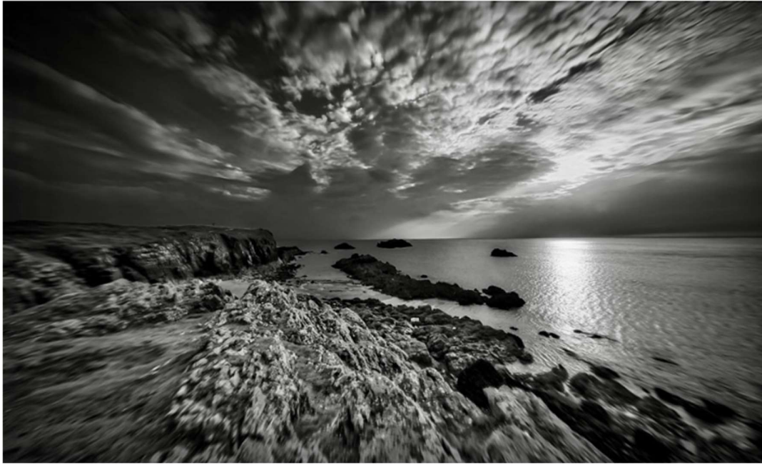
Legenda: Hope. / Ian Haycox/ 16 de setembro de 2023.