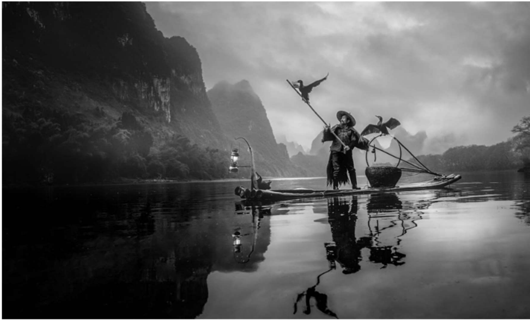
Legenda: Pescador de Corvo-marinho. / Hannes Konig/19 de março de 2019.