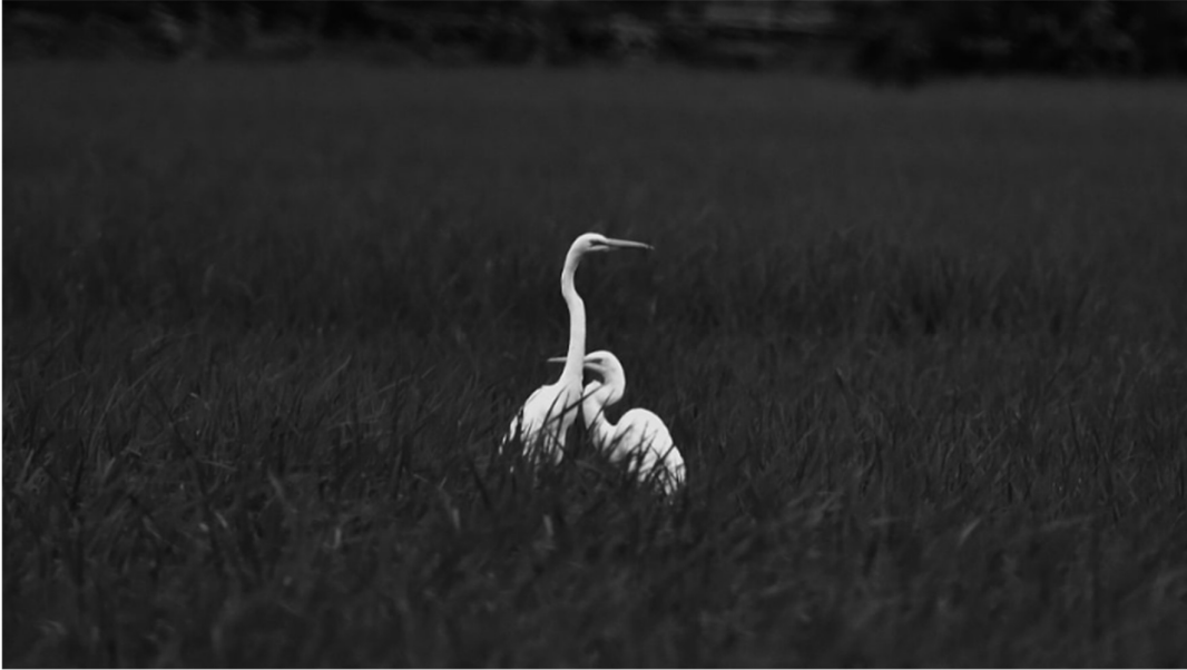
Legenda: Love bird. / Mr.Istiyak Ahammad/ 2 de setembro de 2021