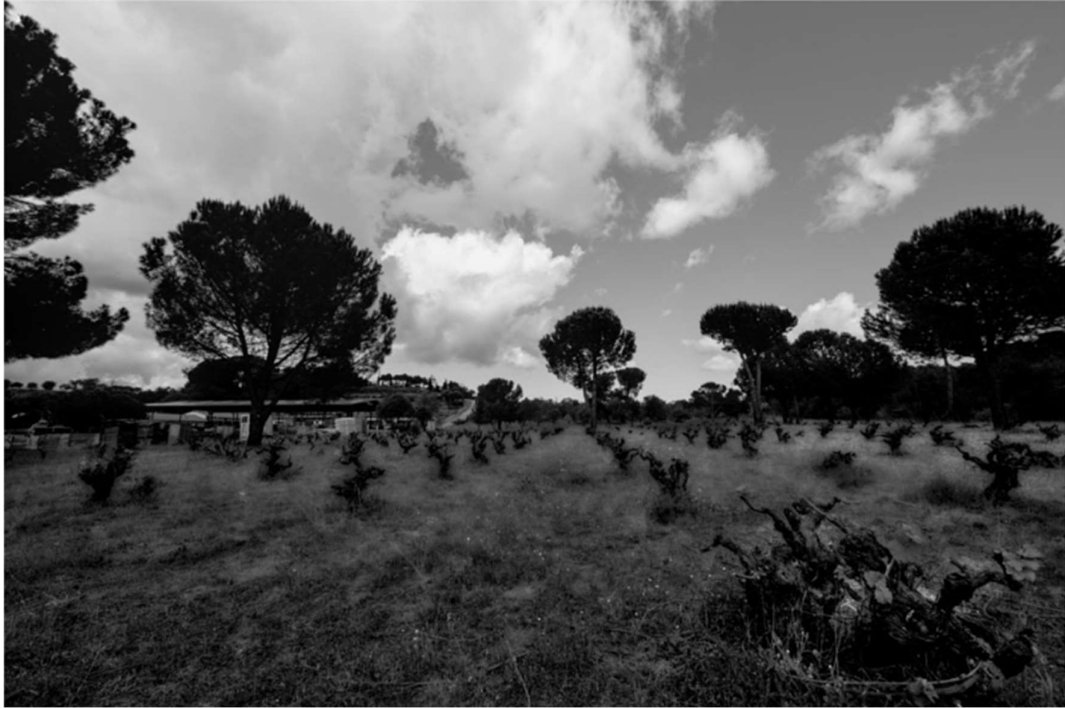
Legenda: Vineyard landscape. / Vicente Molinero/ 22 de Abril de 2023.