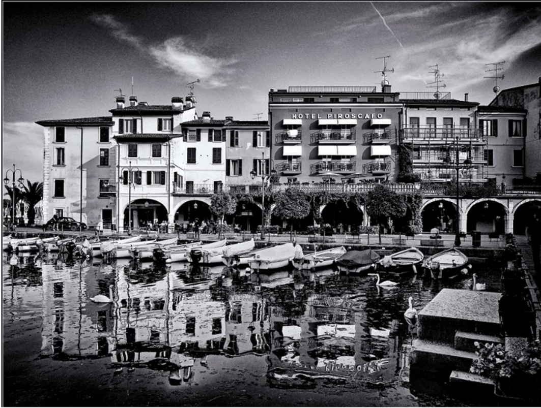
Legenda: Somewhere in Italy. / Andrei Balashov/ há mais de um ano.