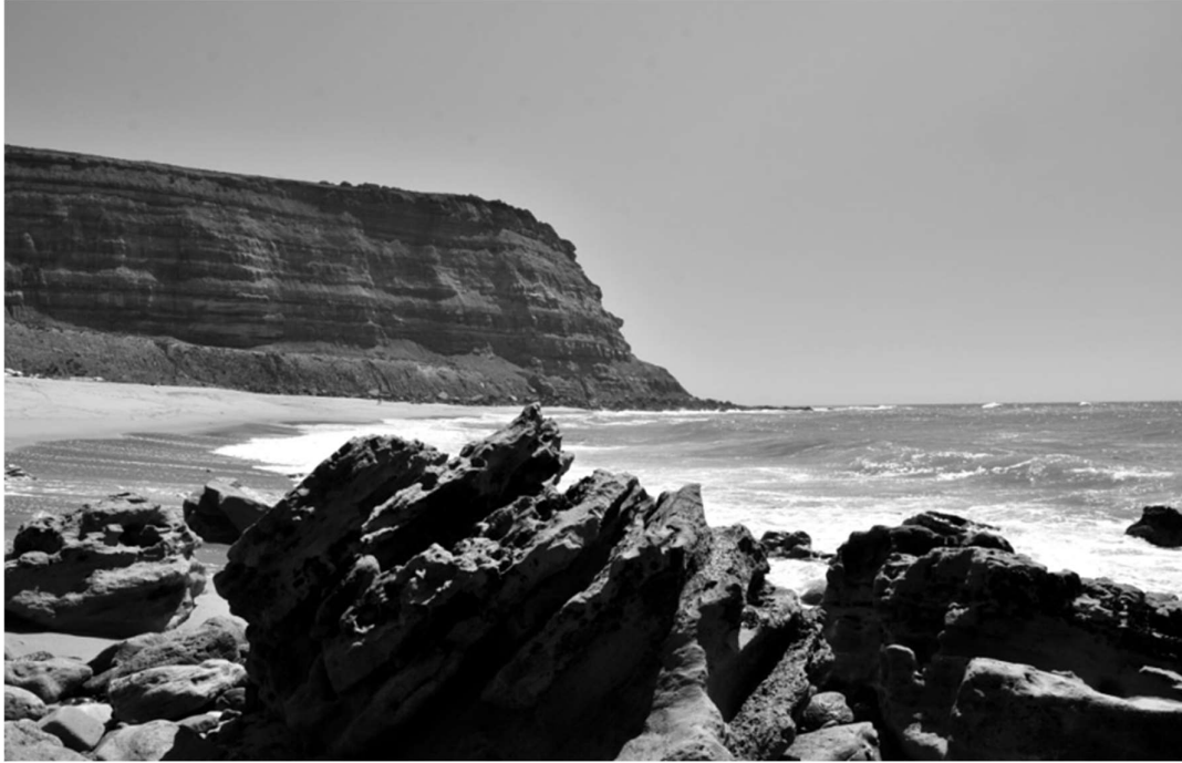
Legenda: Rocks. / Paulo Marques/ 13 de maio de 2023