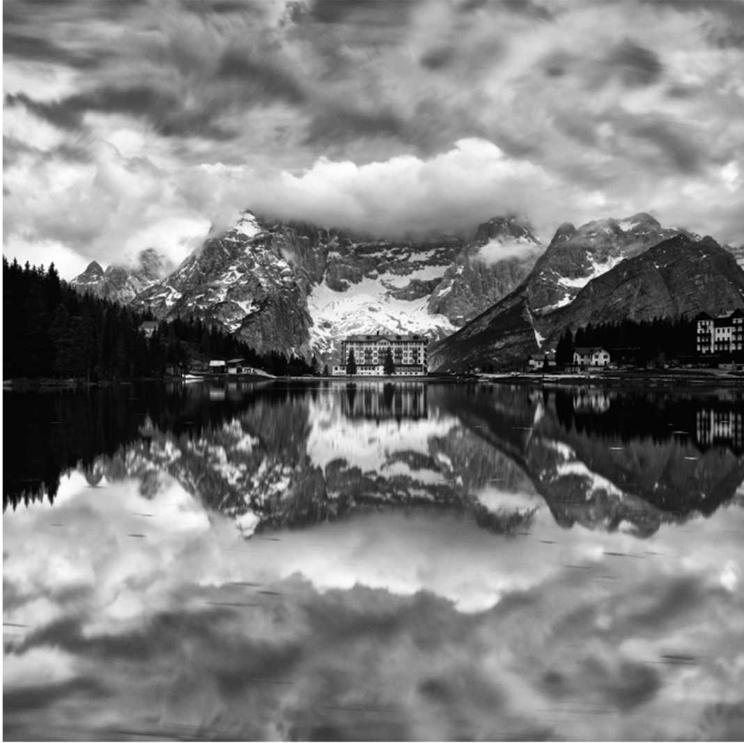
Legenda: Misurina. / Hannibal Height / 28 de maio de 2018.