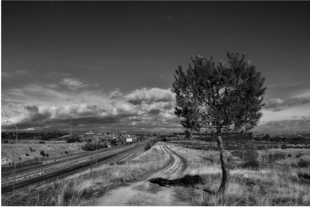
Legenda: Tree, path and motorway. / Vicente Molinero/ há mais de um ano.