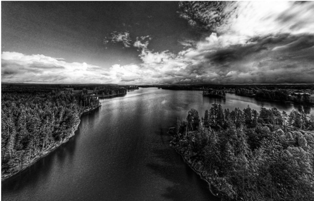
Legenda: Fossby. / Roman P /26 de maio de 2022.