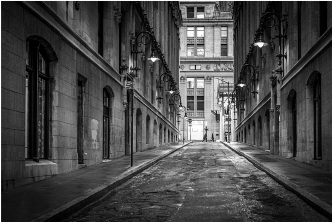
Legenda: Trinity Place, no distrito financeiro de Manhattan, uma pequena rua entre os primeiros arranha-céus da cidade. / Steve Moczarski/ 28 de março de 2024.