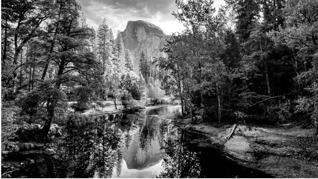
Legenda: Half Dome Reflection. / Alex Rhone/ 4 de novembro de 2022.